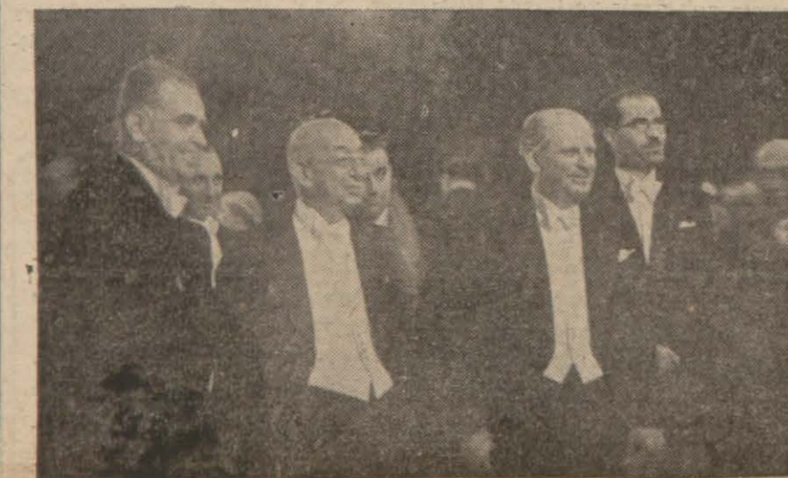
Başvekil Ankarada şerefine verilen ziyafette millî oyunları seyredenken (Yazısı 2 nci sayfada)

Romanyanın Almanya tarafından işgali ve Balkanlar