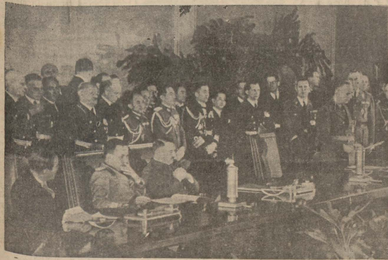
Berlinde üç taraflı pakt imza edilirken

(Resimde Hitler, Ribbentrop, Kont Ciano ve Japonya'nın Berlin sefiri görülmektedir.)