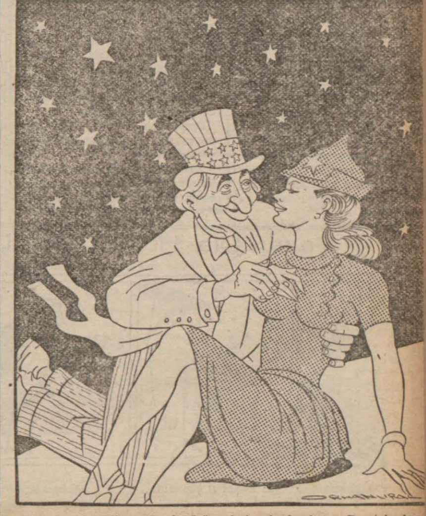
Sovyet - Amerikan siyasi görüşmelerine başlandı. — Gazetelerden «Sevmek ne hoştur yıldızların altında!»

Ankara, 9 (Hususi) — Elâziğ - İran demiryolunun Elâziğ ile arasındaki 70 kilometrelik ihale edilmiştir. Bu kısım için 500 milyon lira sarfedilecektir. Aynı hat Vangölü kenarında Tug mevki kadar olan 330 kilometrelik kısmın etüdüleri de ikmal edilmiş bulunmaktadır.